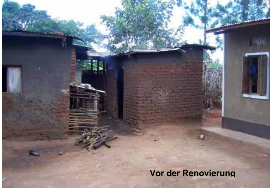
Vor der Renovierung